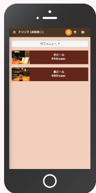
お客様のスマホ画面