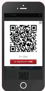
店舗側のホール画面